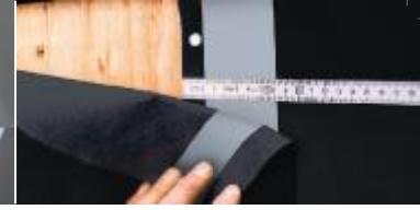
10 cm'lik bindirmeye sahip kaplama örtüleri.