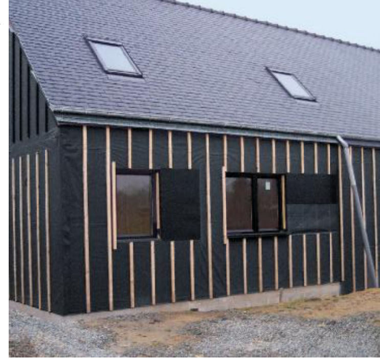
DELTA®-FASSADE S, maksimum 50 mm genişliğinde bağlantılarla açık pervazlar altında güvenli bir koruma sağlar.

DELTA®-FASSADE PLUS ve DELTA®-FASSADE S PLUS, kendinden yapışkanlı bindirme kenarı kısmı ile daha hızlı rüzgara dirençli kurulum sağlanmaktadır.