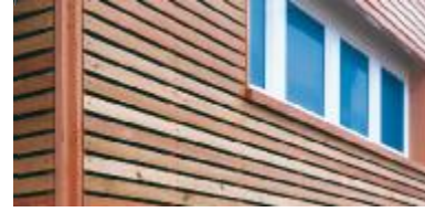
Ahşap direkler ve kirişler için ideal çözümler.