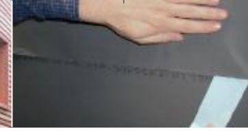
Kendinden yapışkanlı bindirme kenarına sahip DELTA®-FASSADE PLUS.